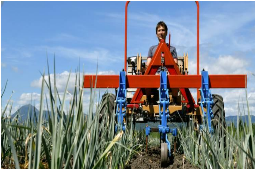
Les secteurs d'activités : primaire...