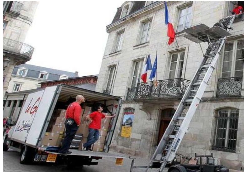
... tertiaire marchand...