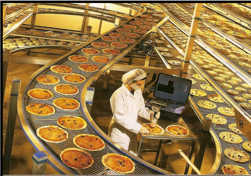
... secondaire ...