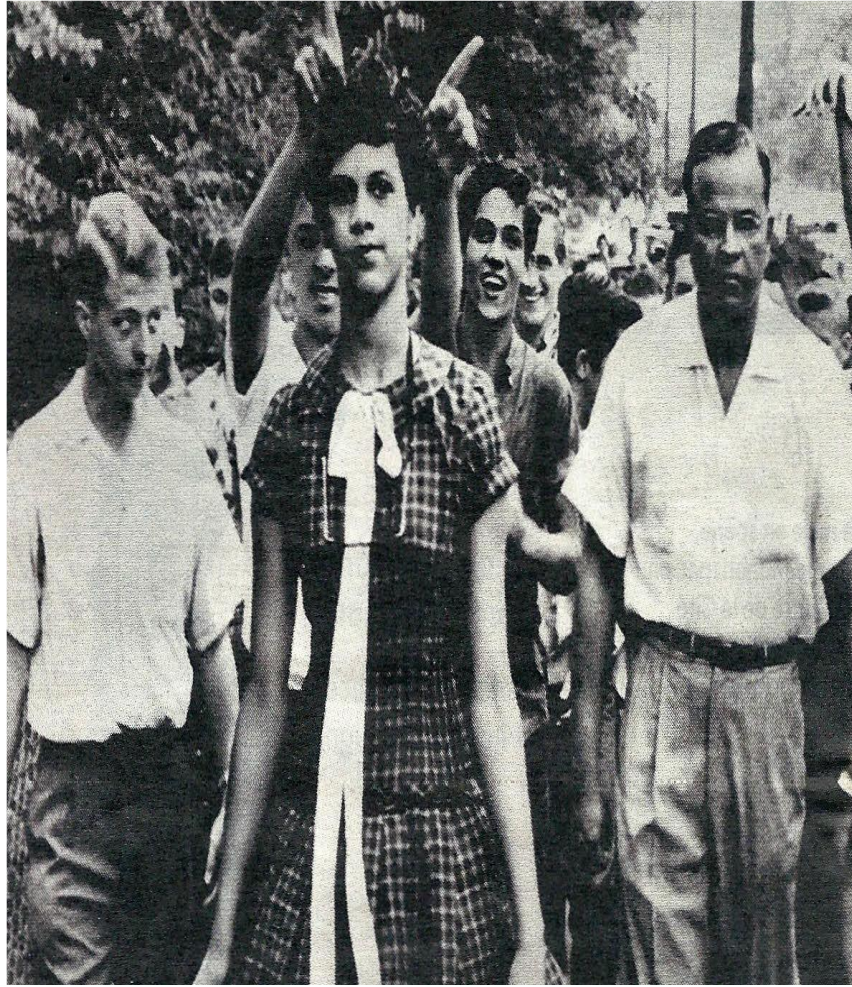
Seule contre tous